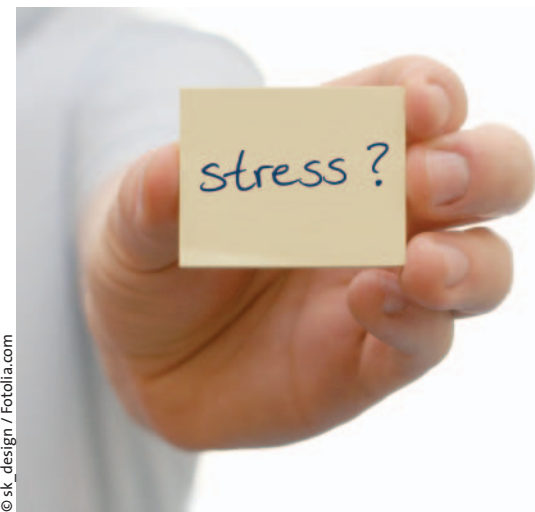
Etwa 25% der niedergelassenen Ärzte und rund 20% der Klinikärzte leiden unter Burnout.

Der Ansatz des Da-Vinci-Zentrums basiert auf neuen Erkenntnissen der Stress-Medizin, der Neurologie, der Psychologie und der Kommunikationswissenschaft. Statt ausschließlich Stress-Symptome mit Entspannung, Wellness, Meditation, Joggen oder Ähnlichem zu bekämpfen, setzt das Da-Vinci-Programm an den Ursachen der Belastungen an, also an unserem gelernten Denken, unseren Einstellungen, Werten und Überzeugungen. Denn unsere inneren Regieanweisungen entscheiden darüber, ob wir etwas als Stress wahrnehmen oder nicht. Ein Konflikt bleibt auch nach dem Joggen noch ein Konflikt. Eine schwie-